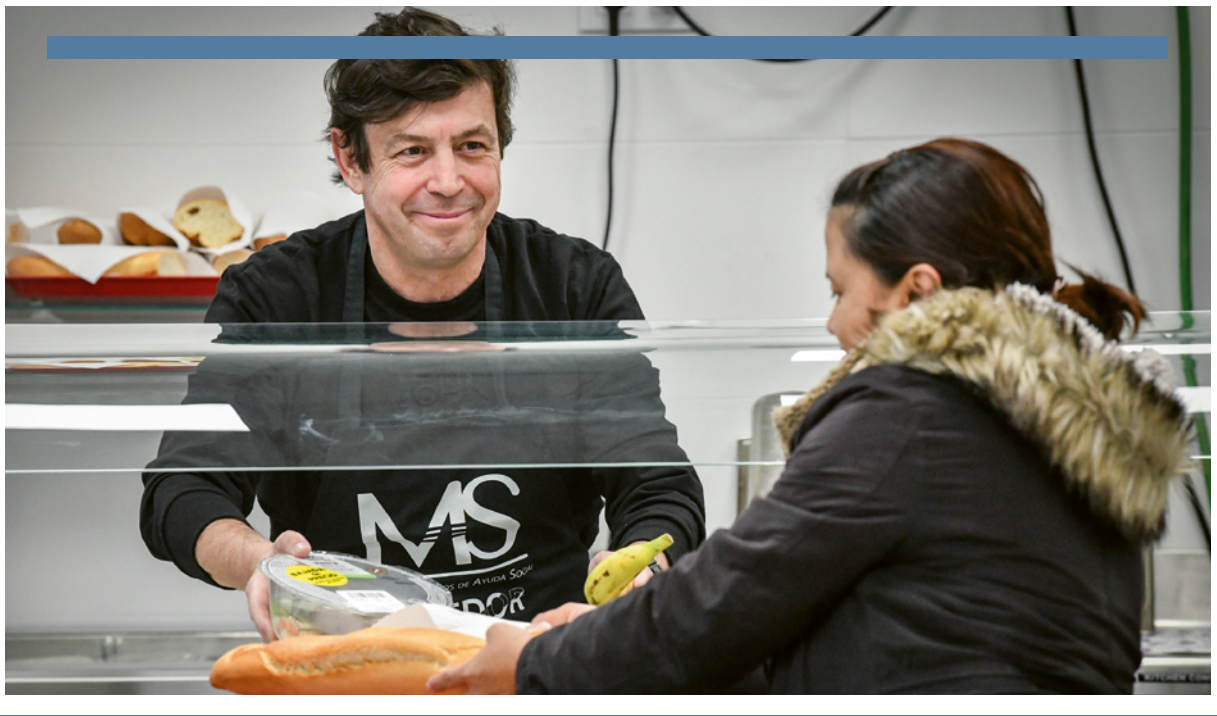
Proyecto de la Asociación Manos de Ayuda Social