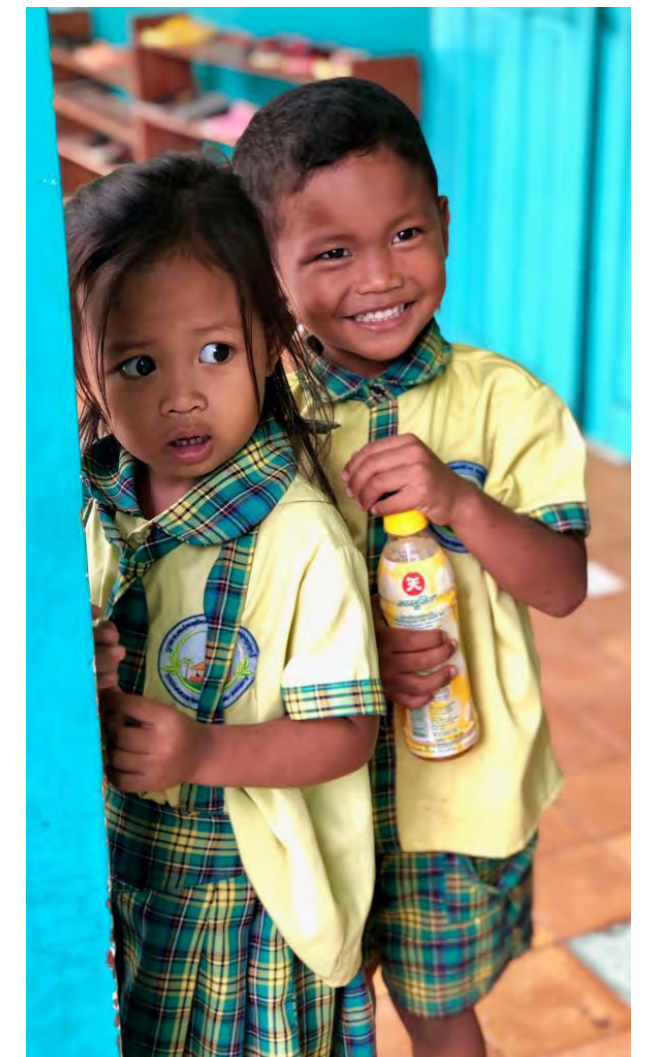
> Proyecto de la ONG SAUCE.