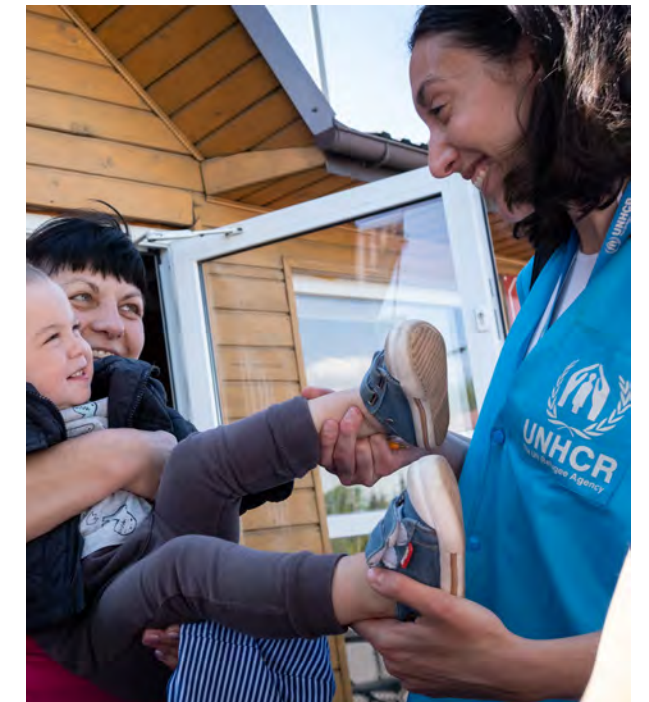
> Proyecto de Acnur © UNHCR / Valerio Muscella.

Además, todas las entidades candidatas debían tener sus cuentas auditadas y en la selección se valoró que hubieran sido acreditadas por la Fundación Lealtad. El objetivo de la Fundación Lealtad, de cuyo patronato forma parte la Fundación Mutua Madrileña, es garantizar la transparencia y las buenas prácticas de las ONG en España.