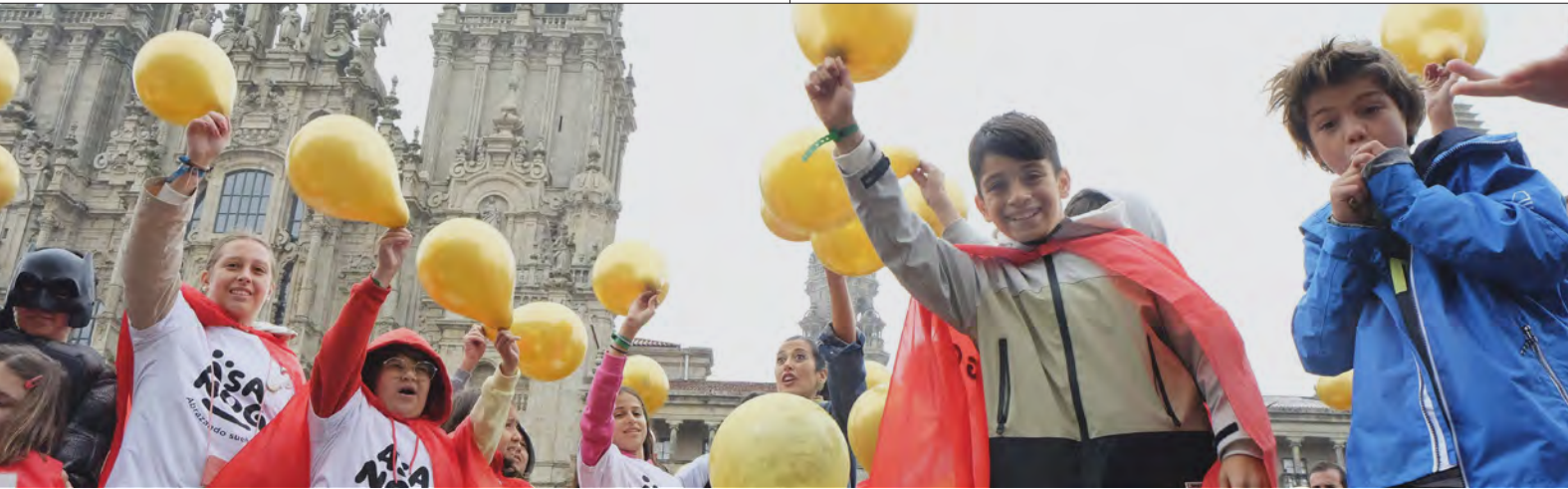
> Proyecto de la Asociación de Ayuda a Niños Oncológicos de Galicia.