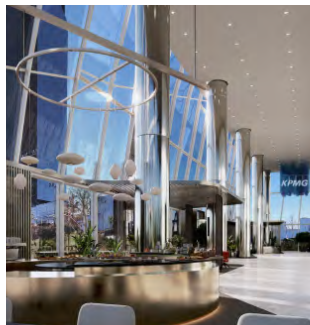
> Nuevo hall de Torre de Cristal.

En el caso de Mutua Madrileña, la excelente ubicación y dotación de nuestros edificios, situados en zonas prime , unido a la gestión activa de nuestra cartera de clientes nos permitió captar nuevos contratos durante el año, así como mantener los niveles de ocupación y nivel de rentas durante el ejercicio.