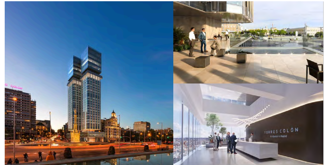
> Recreación de la vista exterior e interior de plantas de Torres Colón.

Entre los hitos del año destacan los proyectos de actualización de espacios en Torre de Cristal y Avenida de Europa, con el foco puesto en la sostenibilidad y el bienestar de los usuarios.