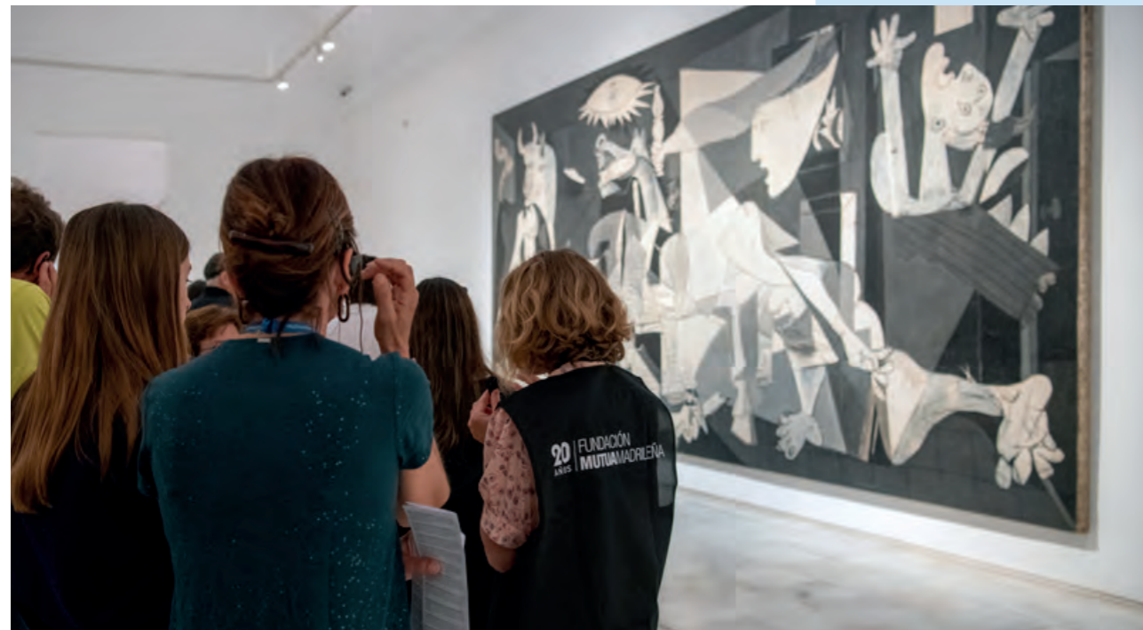
Mutualistas en una visita guiada al museo Reina Sofía.

+1.000 mutualistas platino asistieron a 18 conciertos ofrecidos por la Fundación Ibermúsica