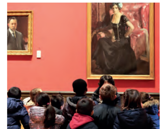
Participantes de un taller familiar en el Museo Sorolla.

Asimismo, el museo organizó, en exclusiva para nuestros mutualistas, 22 talleres familiares dirigidos a niños de entre 4 y 6 años y de entre 7 y 12 años, con títulos como: "El aprendiz de pintor", "La naturaleza es color", "El maletín del pintor", "Pintando al natural" o "El pincel curioso".