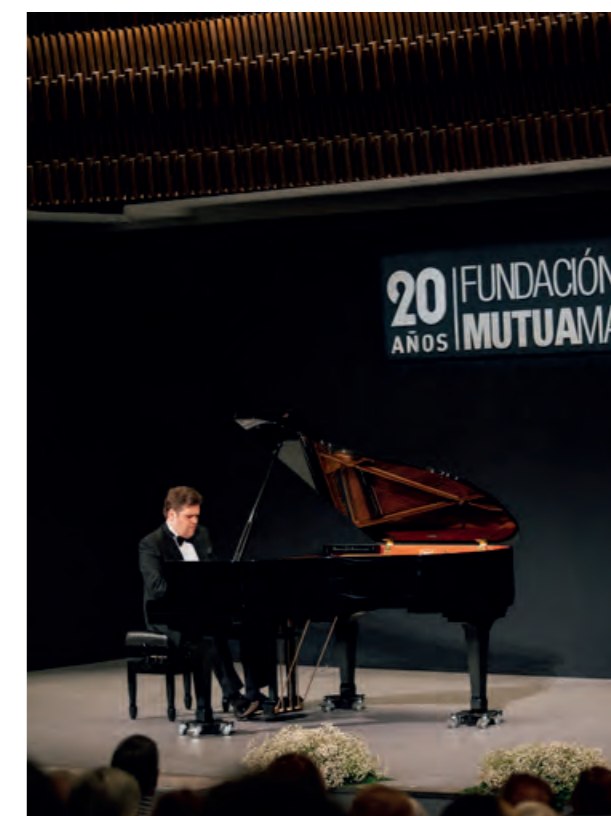
Imágenes del espectáculo de flamenco R-Volución y del concierto de Andrey Yaronshinsky.